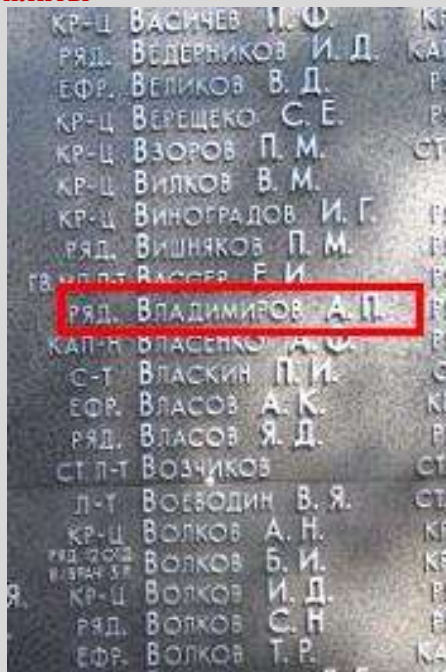
После реставрации в 2015 г.