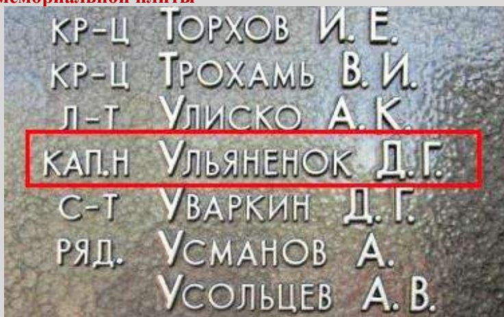
После реконструкции в 2015 г.