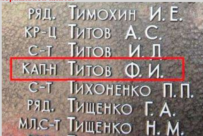
После реконструкции в 2015 г.