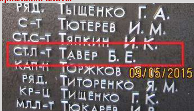
После реконструкции в 2015 г.