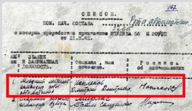
Фрагмент списка командно-начальствующего