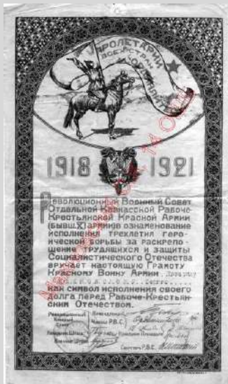
Почётная грамота РВС Отдельной Кавказской Рабоче-Крестьянской Красной Армии