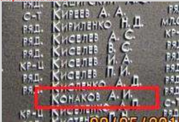
После реконструкции в 2015 г.