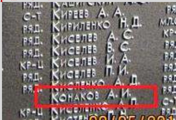
После реконструкции в 2015 г.