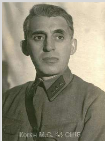
М.С.Коган. Дата съёмки не известна