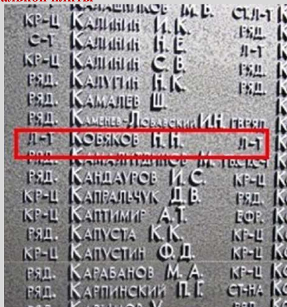
После реконструкции в 2015 г.