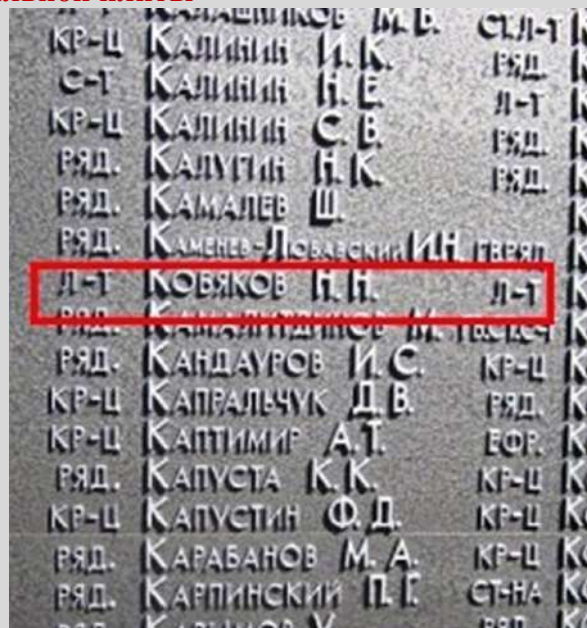
После реконструкции в 2015 г.