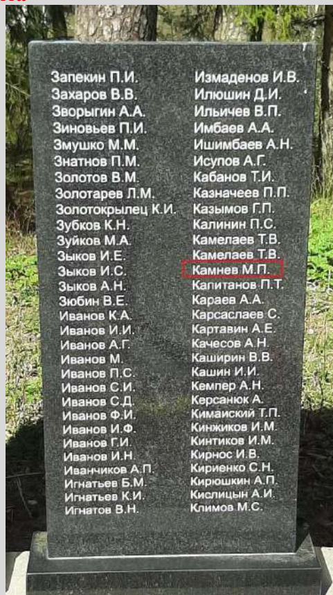
Вид после реконструкции.