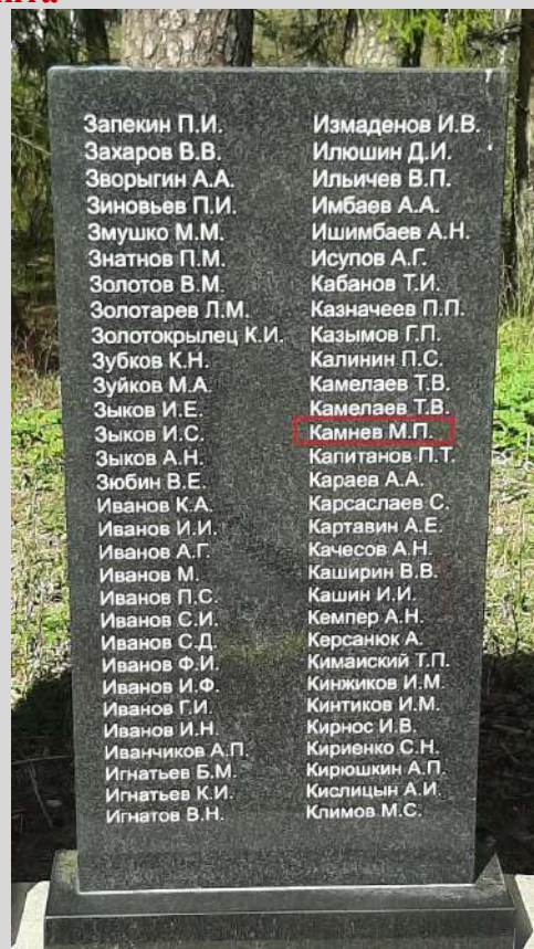
Вид после реконструкции.