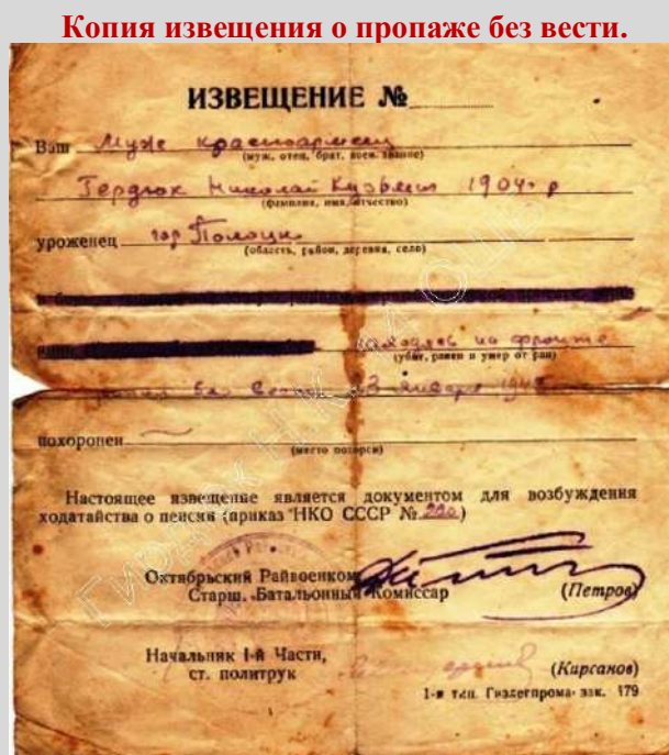
Копия извещения о пропаже без вести.