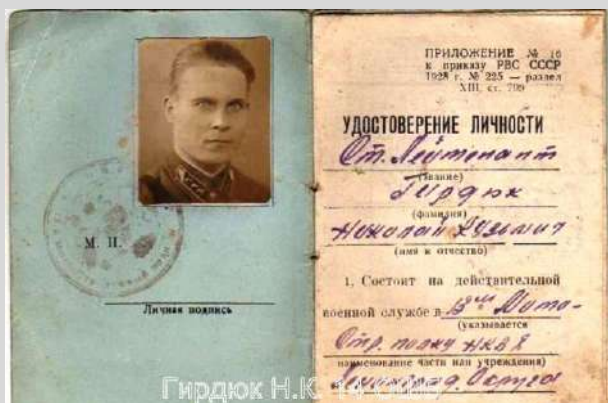
Не позднее октября 1940 г.