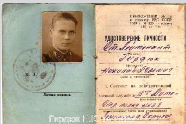
Не позднее октября 1940 г.