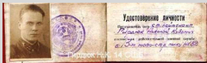
Не позднее октября 1940 г.