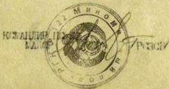
Наградной лист медали «За отвагу» № 2

1921 года рождения, ф.И.К.С., русский, призван Алексан- дровским РВК. Дом.адрес: