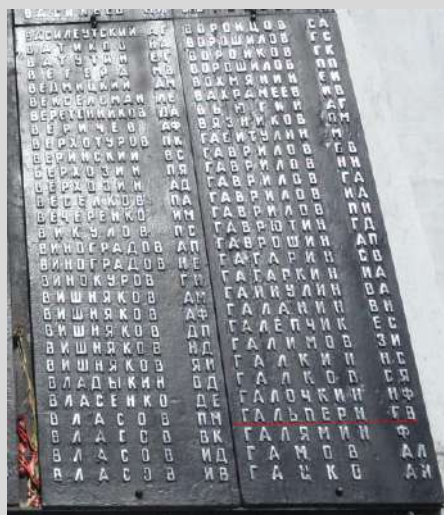
Мемориальная плита на Мемориале погибшим воинам-бодайбинцам в г. Бодайбо