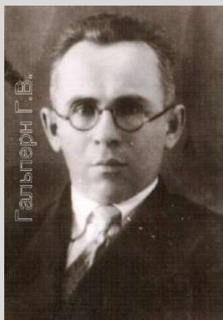
Гальперн Г.В. Начало 1941 г.