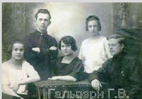
1924 г. г. Киренск Иркутской области. Надпись на обороте: «Члены Киренского УКОМа РКСМ». Дед стоит, бабушка сидит в центре.