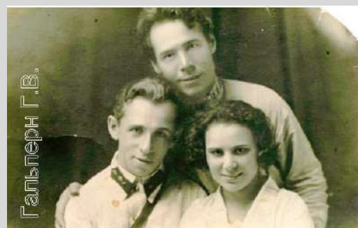
1925 г. Дед с бабушкой сидят. г. Томмот, Якутия