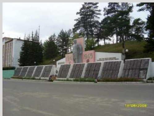
Общий вид мемориала в г. Бодайбо