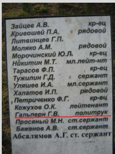
Мемориальная плита на братском захоронении в г. Кировске Ленинградской области