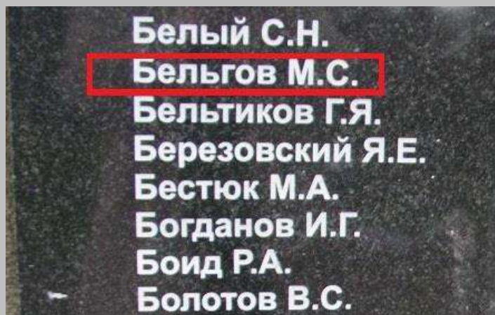
Фрагмент мемориальной плиты (после реконструкции)