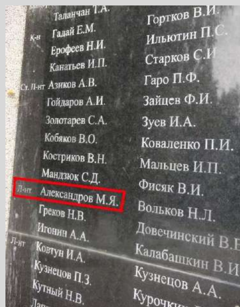
Фрагмент мемориальной плиты