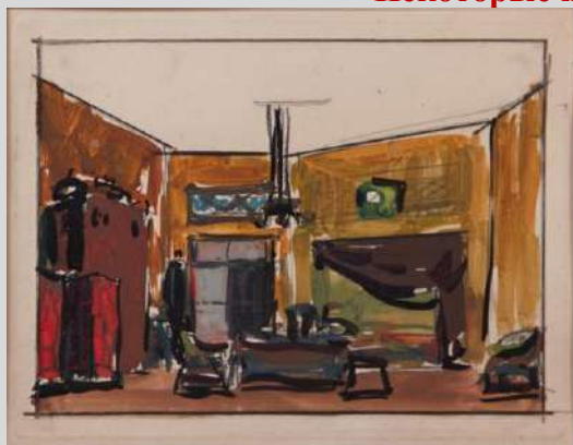
Интерьер к спектаклю 1940