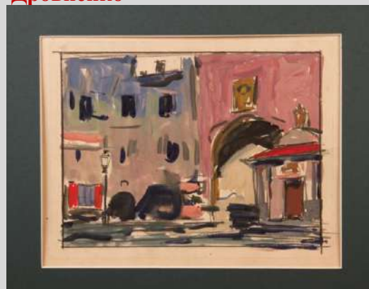
Эскиз интерьера к спектаклю 1940