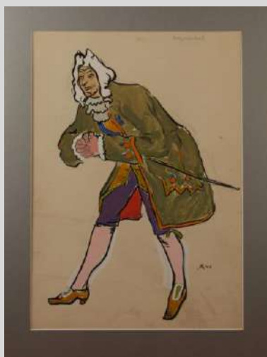
Эскиз костюма к спектаклю (Шереметьев) 1940