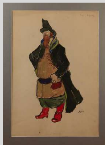
Эскиз костюма к спектаклю (Русский купец) 1940