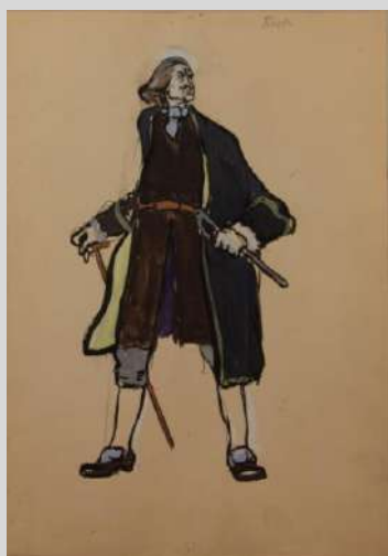
Эскиз костюма к спектаклю (Пётр) 1940