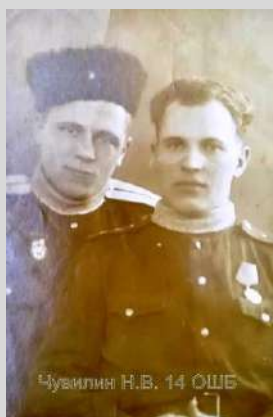
С неизвестным сослуживцем. г. Ленинград, 1944 г.