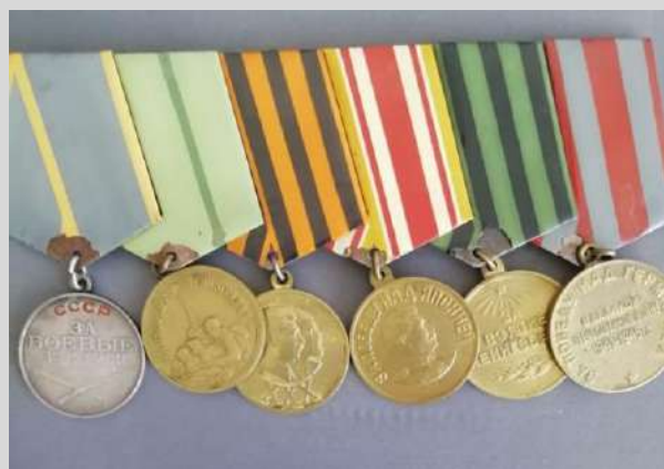
Награды Н.В. Чувилина.