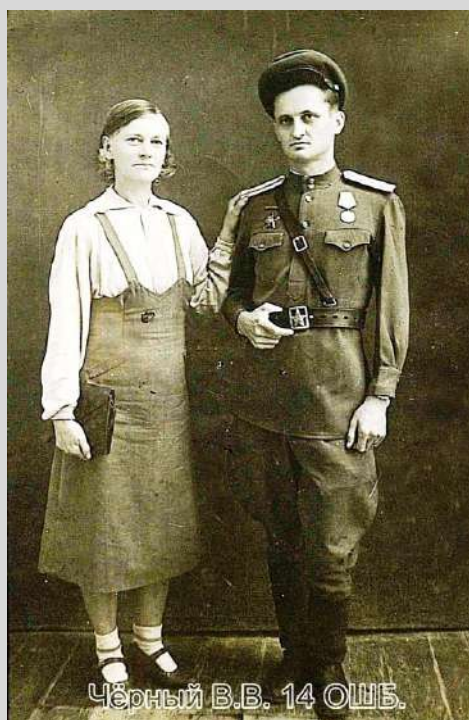
С женой. Даты съёмки не известны.