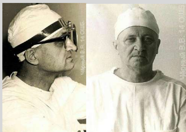
Даты съёмки не известны.