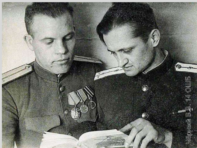
С неизвестными сослуживцами. Даты съёмки не известны.