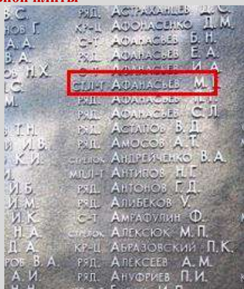
После реконструкции в 2015 г.